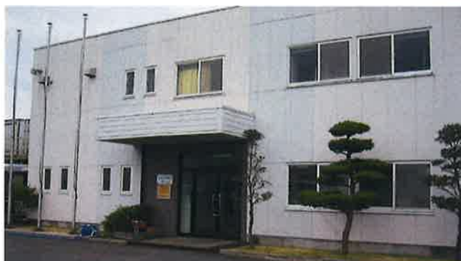
鹿島支店(茨城県・神栖市)