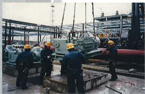
● タービン据付工事