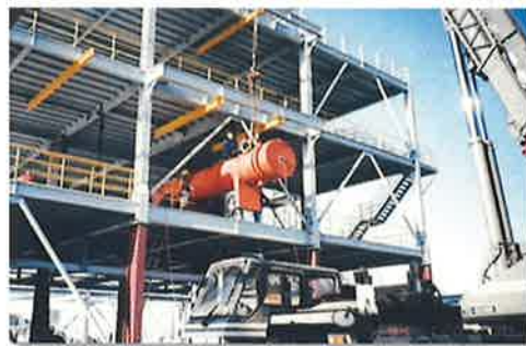
● 熱交換器据付工事