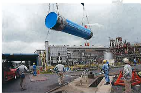
● 乾燥機(ドラム)据付工事